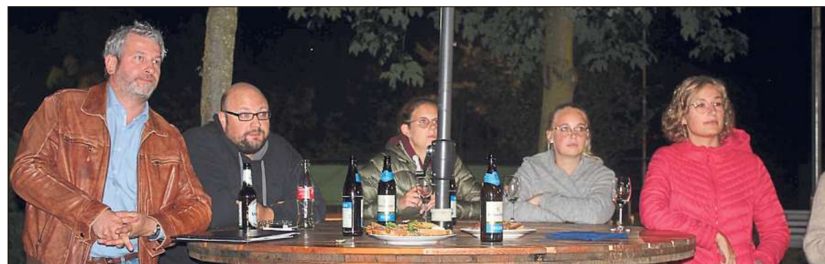
Gut besucht war die Mitgliederversammlung der Tennisabteilung von Blau-Weiß Beelen. Ideal dafür war das Gelände. Das Zusammentreffen fand auf der überdachten Terrasse statt.